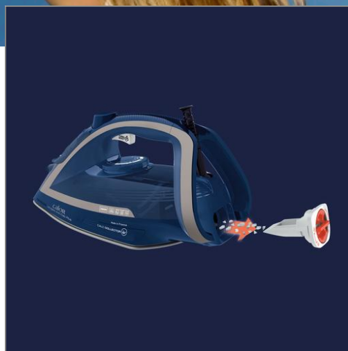
ULTRAGLISS PLUS FV6830+32 FV6830C0