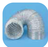
GSA-100 Gaine souple alu