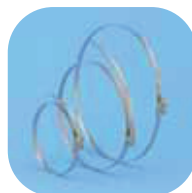
CX-80/125 Colliers de serrage