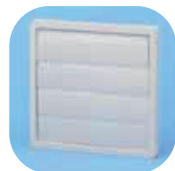
PER-100W Volet de surpression plastique