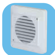
GR-100 Grille extérieure plastique