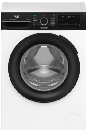
BEKO BM3WFU4861B wasmachine